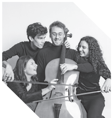
Otilka Quartet