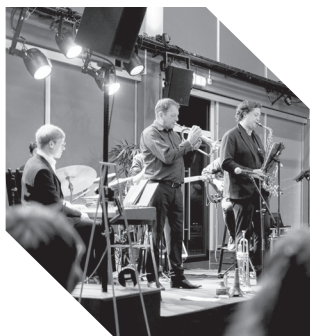
The Jazzmob